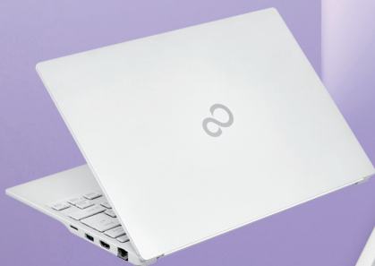
筐体色：シルバーホワイト