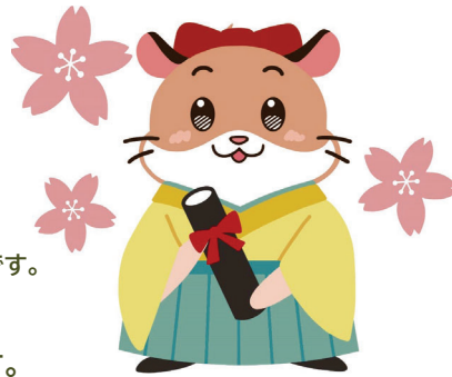
財団公式キャラクター：ハルム

一人でも多くの後輩に援助ができるように、 どうか寄付のご協力を心よりお願い申し上げます。