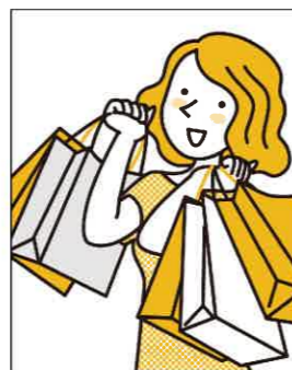
新3年生 地域科学部

私は取得から本格的に運転を始めるまで、1年ほど期間が空きましたが、意外と体が覚えているものです。ペーパードライバー講習も付いているので、安心して運転を始めることができます!