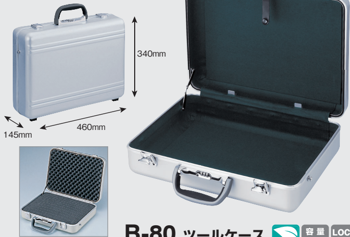
緩衝ウレタン装着例