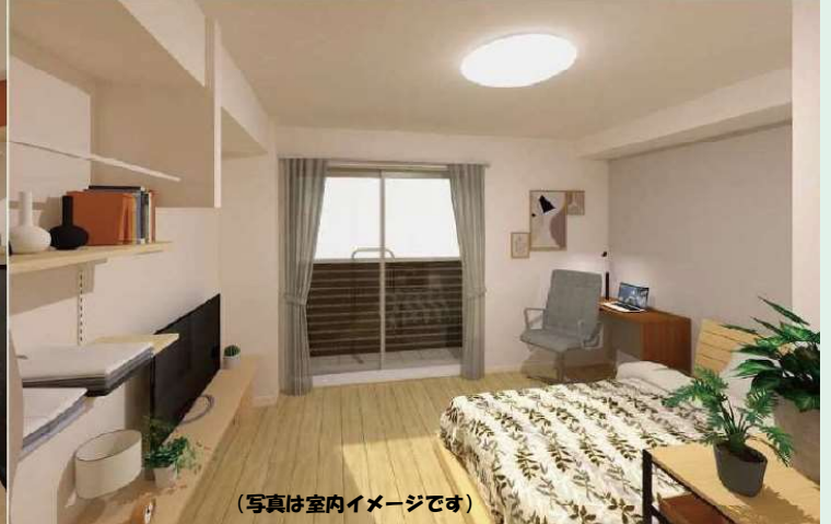
(写真は室内イメージです)