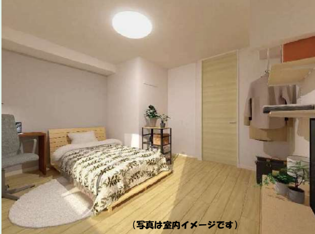
(写真は室内イメージです)