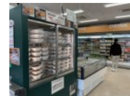
ショップでは手作り弁当を販売!