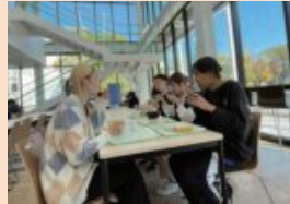
開放感のあるホールで、お食事をお楽しみください!