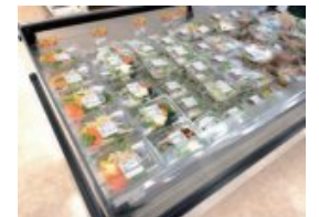
生協サラダも食堂パスの対象です