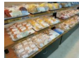
ベーカリーでは焼きたてパンをどうぞ