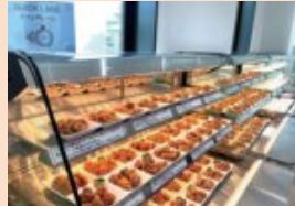
クイックレーンの唐揚げの様子