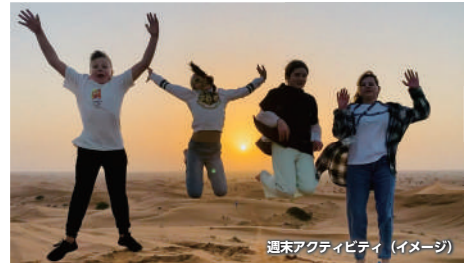
週末アクティビティ (イメージ)