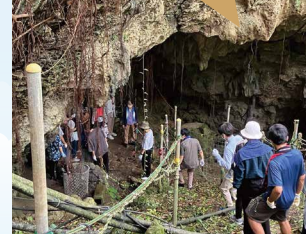
戦場では身ぎれいにも出来ず 苦しんで亡くなっていった女の子が 今の私たちと変わらない女の子 だったということが伝わってきて 苦しくなりました。 (名市大Aさん)

自 然を感じ、未来を考える ・美ら海水族館でのフリータイム ・マングローブカヤックで自然を満喫