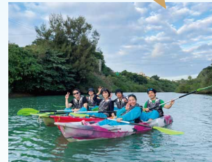
今年新たにカヤック&クルーズ ツアーを追加しました。 米軍上陸地点という歴史的な部分 とマングローブの自然とが共存 した場所を探検することでSDGs について一緒に考えましょう。 (生協職員M)

文 化から多様性について考える ・「まちまーい」で基地のある町の暮らしを散策 ・フリータイムで自分なりの沖縄を楽しむ