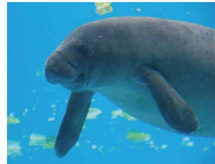
お昼時だとマナティーがキャベツを 食べている姿が見れてとても 可愛らしいです! (中大Tさん)

マングローブの森でクルーズツアーと カヤック体験!定番スポット 「美ら海水族館」も入場します!