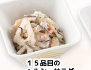
15品目のヘルシーサラダ