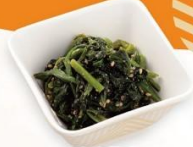
ほうれん草ゴマあえ