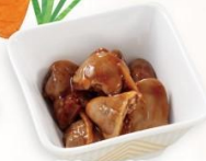
随摩ハーブ鶏のレバー煮