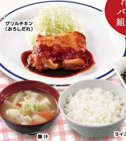
グリルチキン (おろしだれ)