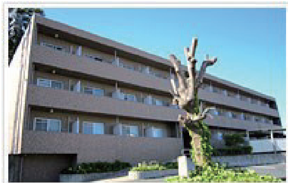
↑ 大学生協オリジナルマンション 棒屋第2下池ハイツ